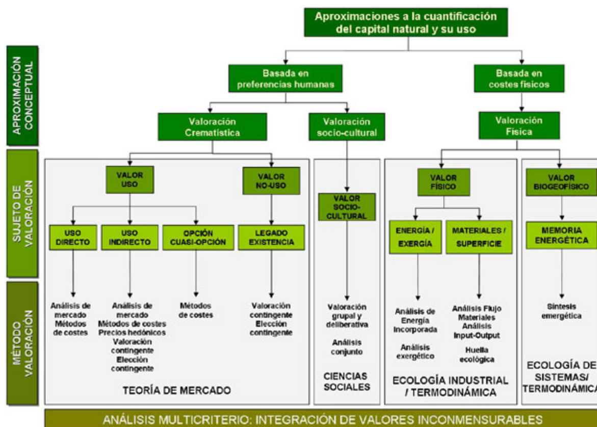
Figura 2. Esquema gráfico referente a las distintas aproximaciones para la cuantificación del capital natural. El valor es una propiedad multidimensional y su estimación puede abordarse desde distintas perspectivas. El análisis multicriterio nos permite considerar distintas formas de valor irreducibles entre sí e incorporarlas como distintos criterios a ser considerados en la toma de decisiones.